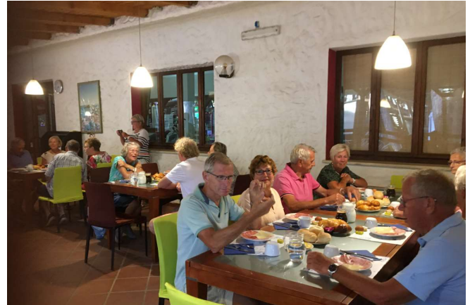
Ontbijt op de camping

camping tussen 13 en 15 uur is gesloten maar dat ze voor onze groep een uitzondering willen maken.