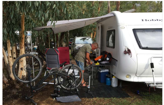
En af en toe is er een lekke band.

De oude baas brengt ons naar het einde van de camping waar 12 plaatsen van verschillende afmetingen zijn dat wordt dus nummertjes trekken. Even moet er toch nog wat geschoven worden maar uiteindelijk heeft iedereen zijn plekje. Bijna iedereen gaat de was doen en door de stralende zon is deze snel droog. Als het donker wordt zijn er problemen met de stroom voorziening die uiteindelijk tegen 21 uur lijkt te zijn opgelost en daar drinken we dan maar een borrel op.