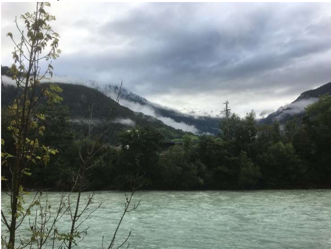
Er is sneeuw gevallen.

Sommigen hebben een probleem om op het juiste moment te kiezen voor de omleiding en rijden zich vast in een doodlopende weg en moeten afkoppelen en draaien, een andere kan net niet op tijd afremmen en raakt de achterlichten van de auto voor hem die geparkeerd staat en laat netjes een briefje achter. Uiteindelijk is iedereen weer goed aangekomen en genieten ze met af en toe een spetterregen van een glaasje. Om 19.45 uur gaan we genieten van onze welkomstmaaltijd en vooral van het superlekker toetje. Tegen 22.00 uur gaan we in de regen terug naar onze caravans en campers.