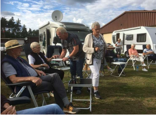
De eerste kennismaking.

moeten nog een keer iets bijtanken in Duitsland. Nadat we de Fernpas hebben gereden worden we telkens op de B 171 opmerkzaam gemaakt dat er een afsluiting is we negeren het tot we een bord zien dat we niet verder kunnen en nemen dan het laatste stukje snelweg door de tunnel om in Prutz aan te komen.