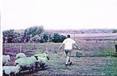
Schaapjes voor de tent,