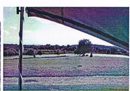
Meer van Annecy