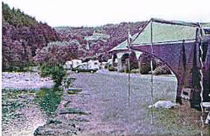
Ons plekje in Vianden