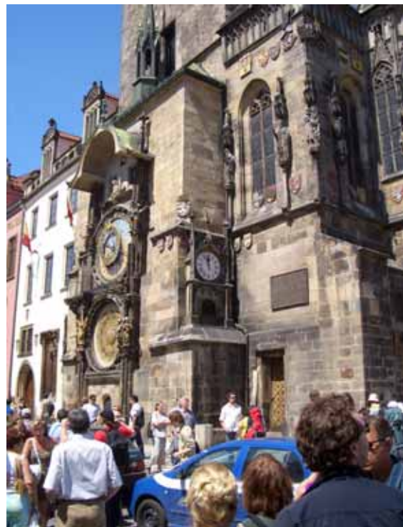
Het Astronomisch uurwerk