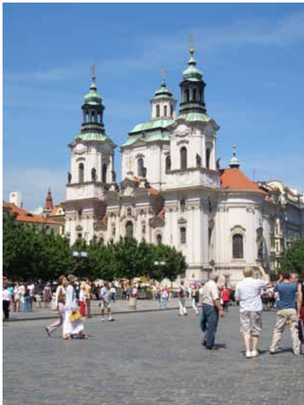
St.Nicolaaskerk bij oude Stadsplein