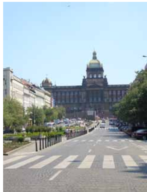
Het nationale museum