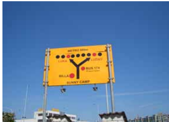
verwijzing naar bus ,metro en supermarkt