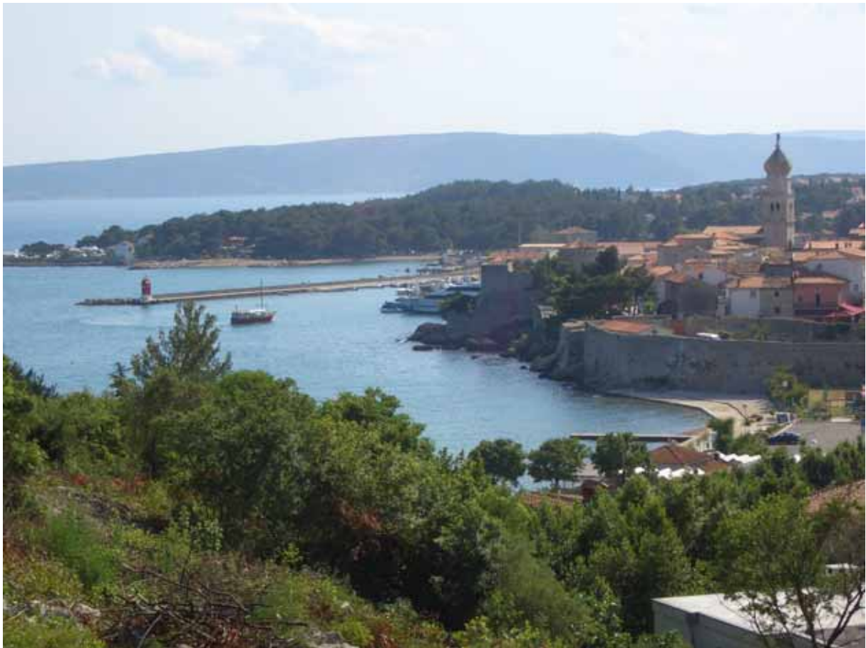
Stad Krk met haven, camping en vestiging.