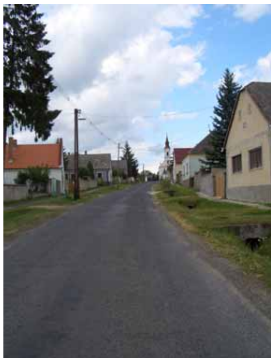
Hongaars dorpje Mensshely