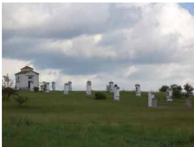
De kruisweg van Barnag met zijn 14 staties