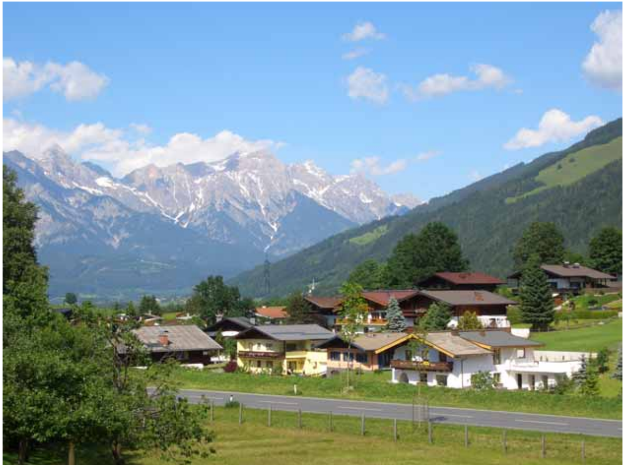
Maishofen in het Salzburgerland