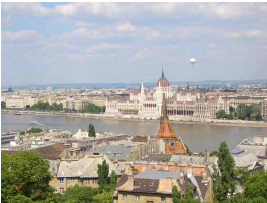
Pest gezien van uit Buda