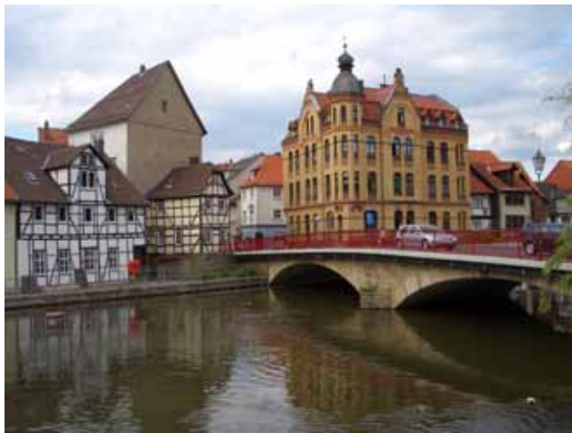
Eschwege aan de Werra

Terug op de camping lekker lezen en een dutje en weer lezen tot aan de koffietijd. We gaan de weg naar Praag bestuderen en vinden uiteindelijk de camping die we moeten hebben op de kaart. We gaan redelijk op tijd onder de dikke dekens want het koelt nog stevig af in de nacht.