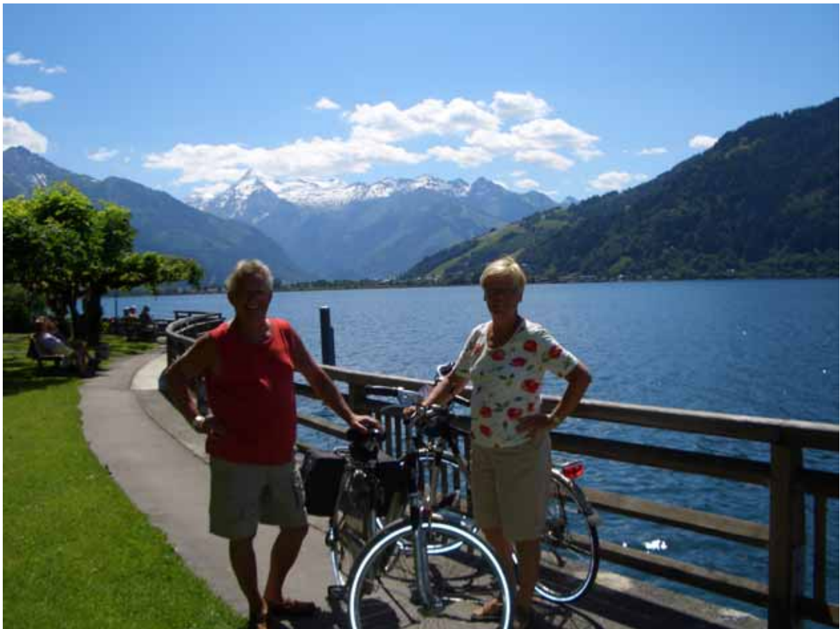
Zell am See heerlijk fietsen