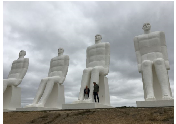
De 4 mannen bij Esbjerg.

Maandagochtend vertrekken wij met Jan en Ine om 8.30 uur om eerst naar Blåvand te rijden en naar de 9 meter hoge beelden van 4 mannen te kijken. Als we daar aankomen herken ik het niet en vraag er naar en dan blijkt het dat deze beelden bij de haven van Esbjerg staan, kun je na 10 jaar dus erg vergissen in je herinnering. We rijden naar Esbjerg en waarschuwen de anderen via de Whatsapp groep. In Esbjerg maken we snel de foto's het stormt enorm en het is nog maar 14 graden.