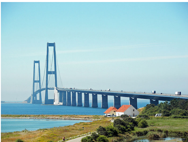
De brug over de grote Belt.

Hij aait ze en voed ze haring hij maakt er als het ware standbeelden van en gaat ze dan zelf fotograferen met zijn mobiele telefoon. We gaan daarna per fiets om het park heen en komen bij een meertje waar om heen fietsen en een tosti eten bij een tentje. Inmiddels is het helder en warm geworden en bij terugkomst op de camping wordt er koffie thee en wat koels genuttigd. Morgen gaan we naar het eiland Fünen maar de dag wordt sterren klaar afgesloten het is bijna volle maan.