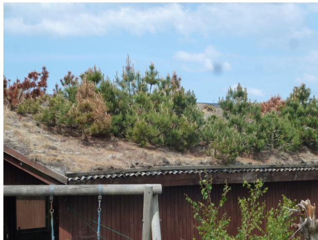
Bomen op het dak!

Niemand kon raden dat we gingen bellen blazen. 23 bejaarden die op de camping bellen blazen is denk ik nog niet eerder voor gekomen. Daarna hebben we met zijn allen nog een gezellige avond van kunnen maken want het weer is heerlijk en aangenaam. Woensdag gaan we eerst de panorama route fietsen die je voert door een schitterend duinlandschap. Er staan veel zomerhuisjes in allerlei verschillende daken. De een is met gras begroeid dan weer met mos en zelfs een dak met allemaal kleine dennenboompjes op het dak. Het is deze dag weer stralend weer en de zon brand er lustig op los, de boeren beginnen steen en been te klagen en wij eten een lekker ijsje op het terras in Lakolk.