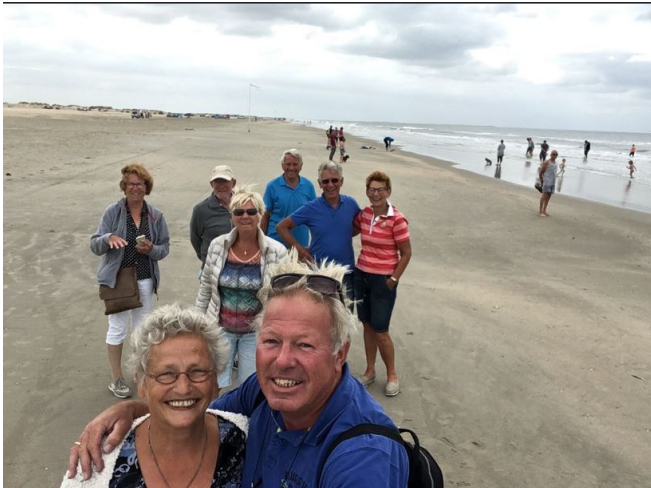
Het strand van Rømø

Om 12.30 komen we aan bij Rømø familie camping, de eigenaar heet ons welkom en legt uit waar hij voor onze groep een veld heeft gereserveerd. We besluiten om alles zodanig op te stellen dan de deur op het zuiden is gericht en dat we zo het minst last van de wind zullen hebben. Wij adviseren om nog te wachten met opbouwen van de luifels en voortenten.