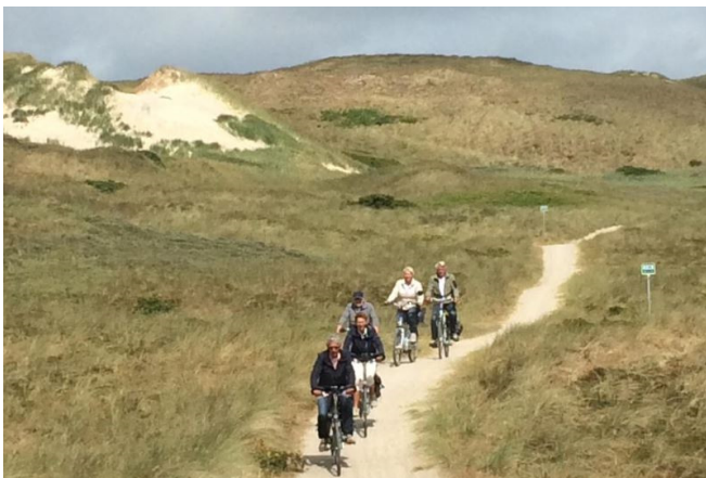
Dapper door de duinen 110 km gefietst.

Wij flaneren een beetje door dit bijzonder gezellige strandstadje. Regelmatig ontvangen we een app hoever ze gevorderd zijn en dat ze al regelmatig in de zon fietsen terwijl het in Ringkøbing nog licht bewolkt is. Tegen 18.00 uur zijn ze in Ringkøbing waar eerst nog een maaltijd wordt genoten en daarna worden ze met applaus op de camping begroet. Vrijdagmorgen is half bewolkt maar een sterke noorderwind weerhoudt ons er niet van om toch een route van 35 km te fietsen gelukkig schijnt de zon weer regelmatig en dat verlicht toch wel een beetje. In de avond wordt er of voetbal gekeken of spelletjes gespeeld in "ons clubhuis" nadat België gewonnen heeft van Brazilië klinkt er een gejuich los als of Nederland gewonnen heeft.