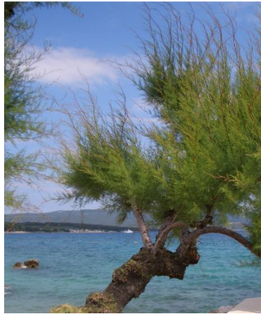
De Adriatische kust bij Krk.