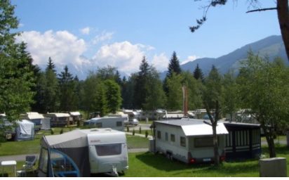
Camping Maishofen rustig genieten.