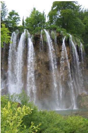
De watervallen van Plitvicka