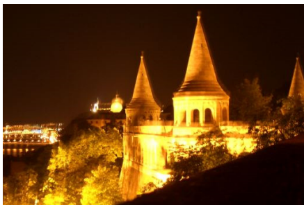
Boedapest bij avond

Al na 100 km zijn we op de camping aan het Balaton meer en nu maar hopen dat het lekker weer is.