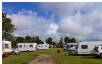
Camping Dråby Strand

Zaterdagmorgen boodschappen doen er is een weekmarkt in de stad maar we kopen uiteindelijk alles in de supermarkt. Na de middag is iedereen binnen en met 2 auto's gaan de dames naar de outlet in Neumünster wat tot gevolg heeft dat we de bijeenkomst borrel een half uurtje later beginnen. Het is een stuk kouder geworden dus na de uitleg en de rij indeling wordt er al snel de caravan of camper opgezocht. Zondagmorgen rijden we om 8.30 uur als eerste weg samen met Ellie en Willy, nou het werd een erg natte rit de buien bleven ons volgen en bijna de gehele weg hebben we regen ja zelfs veel regen gehad. Jammer dat het uitzicht soms maar een paar meter was. Na aankomst op camping Dråby Strand nabij Ebeltoft, zetten we in stormende regen onze luifel uit en trekken nadien droge kleren aan. Enkele dames gaan bridgen en de mannen voetbal kijken.