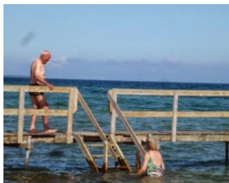
Moedig het zeewater in