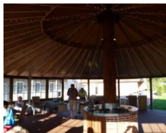
Prachtige 5 * barbecue ruimte

Dondermorgen doen we eerst de inkoop voor de barbecue die we 's avonds weer gezamenlijk organiseren. We willen er niet zoveel werk van maken als de vorige keer ja dat was echt de bedoeling! Maar er zijn altijd wel weer dames die zich weer extra willen inspannen dus verschijnen er toch weer heerlijke salades in de speciale barbecue ruimte van camping Ribe .