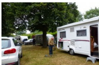
Bij Helmuth ben je altijd hartelijk welkom.

Donderdag 14 augustus rijden we samen met Til en Dick uit Aalsmeer naar onze eerste camping in Bad Bramstedt net voorbij Hamburg. We worden zoals altijd aller hartelijkst door Helmuth ontvangen en installeren ons achter in het hoekje. 's Avonds gaan we in de stad heerlijk eten lekker Duits mooie Schnitzel met lekkere patat en salade. Vrijdag gaan we om 12.00 uur fietsen en net op dat moment komt de eerste reisgenoot binnen rijden. We fietsen een rondje van ca 25 km maar we worden door en door nat we worden overvallen door een bui die bijna een uur duurde, schuilen kon niet meer het stortte ook door het dikke bladerdak van de bomen heen. Later op de dag komen er nog meer eisgenoten binnen en zitten Ria en ik nog tot middernacht heerlijk buiten.