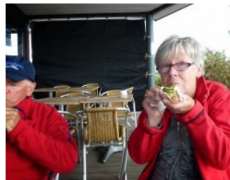
Deense Hot Dog zeer verassend.