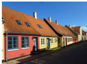
Aerokøbing een mooi stadje.

Als we dan even na 15.00 uur weer aankomen in Aerokøbing fietsen we door het stadje over de hobbelige kinderkoppen, drinken een glaasje op een terras bij de haven en besluiten dan om maar met de ferry een uur eerder over te steken. Als we dan de ferry verlaten blijkt dat de ketting van Ellen haar fiets is afgelopen. We laten Ellen met de honden achter en Roelf gaat haar nadat we de parkeerplaats bereikt hebben weer ophalen. Het was een dag waar we Denemarken hebben ontdekt wat we nog niet wisten en nog niet eerder waren geweest. We vonden het een super dag.