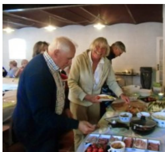
Genieten van zelf gemaakt Smørregasbrød

Donderdagmorgen ga ik vissen in de Oostzee, ik vang 4 kleine scholletjes en geniet van een dartelende zeehond die op 10 meter uit de kust zwemt en erg nieuwsgierig is wat ik aan het doen ben. In de middag gaan we samen met Tonny en Wil een route controleren die dwars door het Molsbjerg natuurpark gaat lopen. Op een paar kleine fouten na loopt het goed tot net naar Rødby waar we een weg niet kunnen vinden. We zoeken een alternatief en die vinden we met een prachtig grindpad welke ook goed te fietsen is dwars door een bos langs een paar mooie meren. De route is 50 km lang en geeft een goede indruk van het gebied Dursland. Vrijdagmorgen gaat Ria met nog enkele dames naar het museum fregat Jylland welke in de haven van Ebeltoft ligt. Ik ga met Ellen inkopen doen omdat we vanavond een Deens smørregasbrød willen genieten met zijn allen.